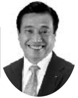
県議会議員 中根ぎいち